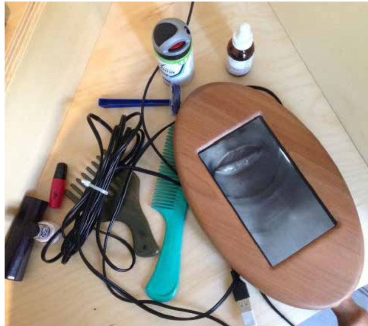
RijksOpen 2019. Anderu Immaculate Mali, 'Dressing Chamber II, 2019'

STAMPA 'Talk Art Show Art' 2019, 4 keer een talkshow 'over kunst en kwesties' in W139