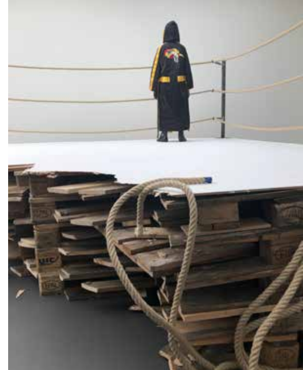
Stichting Rozenstraat 59. Tentoonstelling van Grace Schwindt 'In Silence'

Stichting Stokroos ontving ook in 2019 de meeste aanvragen uit Noord-Holland: 142 (49%). Daarvan gaven 131 aanvragers Amsterdam als standplaats op. Op behoorlijke afstand staat Zuid-Holland met 66 aanvragen (23%). Hiervan gaven aanvragers 30 Rotterdam en 23 Den Haag op als standplaats. Met respectievelijk 32, 19 en 14 aanvragen volgen de provincies Utrecht (11%), Gelderland (7%) en Noord-Brabant (5%). Vanuit de overige provincies ontvangt Stichting Stokroos sporadisch aanvragen, vanuit Overijssel, Zeeland en Caribisch Nederland in 2019 zelfs geen. Eén aanvraag kwam van een aanvrager gevestigd in het buitenland.