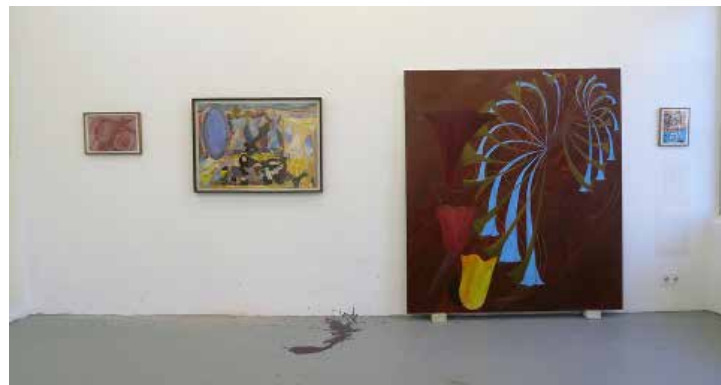
RijksOpen 2019. Dan Zhu