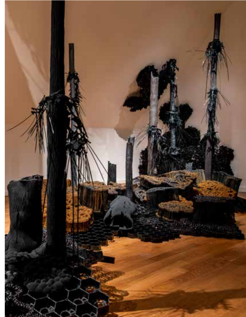
Tanja Smeets. 'Liquid Garden' in Museum Prinsessehof, Leeuwarden