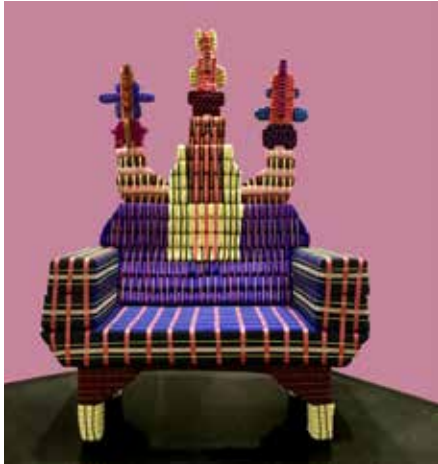
Saar Scheerlings. Talisman Throne For Two