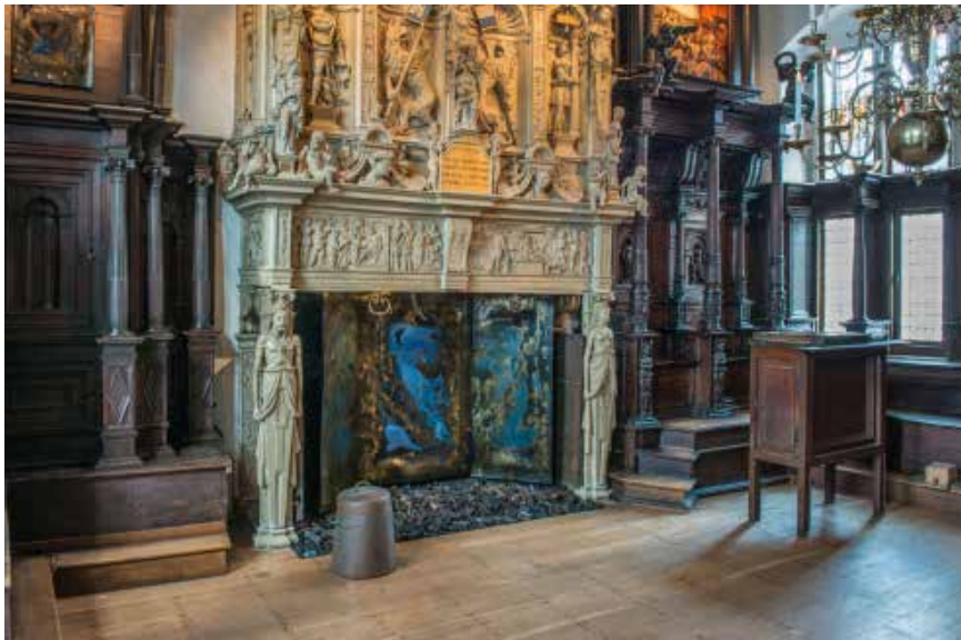
Sybil Heijnen. 'Spreekend verleden' Museum Kampen