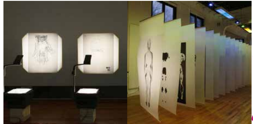
Machteld Aardse en Lyske Gais: OUTER SPACE bij 37PK