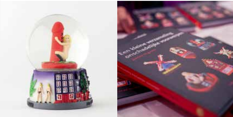
Jimini Hignett. Een Kleine Verzameling van Onschadelijke Objecten.