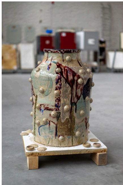
Werk van Ceel Mogami de Haas tijdens zijn werkperiode bij het EKWC