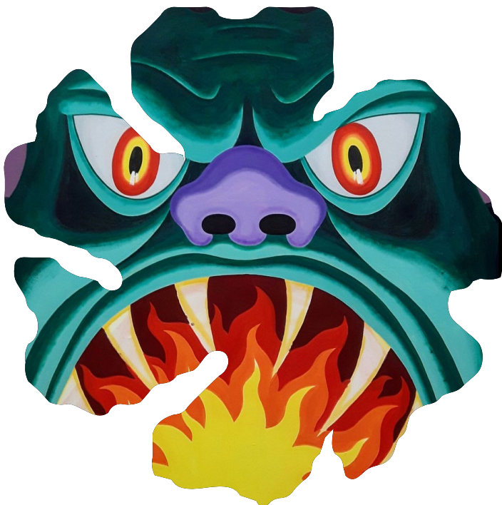
Remy Neumann, 'Groene demon'

Al met al heeft Stichting Stokroos in 2023 een zeer grote verscheidenheid aan voorstellen van hoge kwaliteit kunnen ondersteunen. Bijzondere en kleurrijke projecten en praktijken waarbij makerschap in evenwicht was met de uitdagende concepten of het engagement die eraan ten grondslag lagen. Maar ook de underdog, de regio en diversiteit kregen die aandacht die zij verdienden.