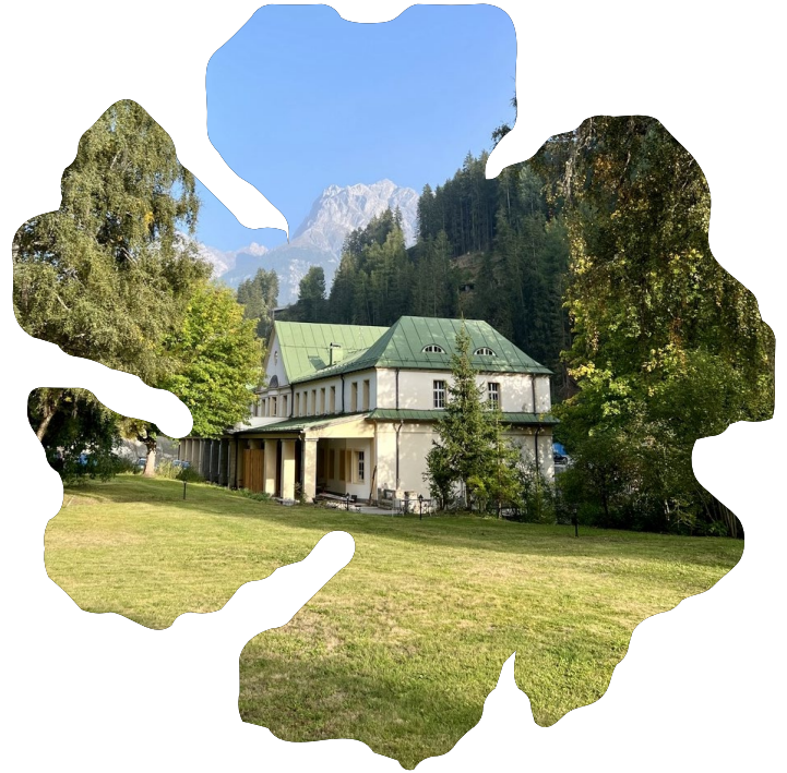
Fundaziun Nairs, foto: Franciska Meijers

eva onderscheidde zich met een uitdagend voorstel voor haar verblijf, gericht op lichamelijke ervaring, performance, geluid, ecologie en de helende werking die aan het gebied wordt toegeschreven. Ze beoogt een verbinding te leggen tussen feministische videokunst uit de jaren zestig van vorige eeuw en hedendaagse visies op de relatie tussen mens en natuur. Naast het uitvoeren van onderzoek en experiment zal ze dieplisting-sessies en publieke workshops organiseren. De selectiecommissie was niet alleen overtuigd van de kwaliteiten van eva, maar gelooft ook dat zij met haar plan een waardevolle en spannende aanvulling zal zijn op het residencyprogramma.