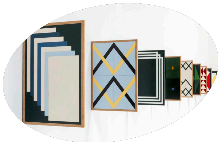
Bart Lunenburg, "Hoeders van het land", Kunstenlab

Daarnaast startten we met afgebakende aanvraagperiodes, die vooraf gecommuniceerd werden. Die zorgden echter niet voor een vermindering van het aantal aanvragen, maar leken een tegengesteld effect te hebben. Het kader van voorwaarden en criteria bleef voornamelijk grotendeels ongewijzigd, maar we voorzien hierin aanpassingen om ervoor te zorgen dat het aantal aanvragen in een realistische verhouding tot het besteedbare budget komt te staan.