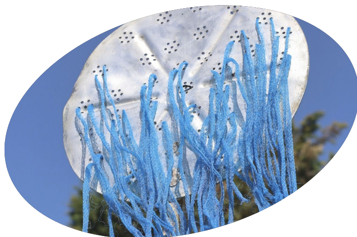
Wessel Verrijt, 'Fluid Stones // Moving Entities', h3h biënnale

Het bestuur stelt vast dat het budget conform de jaarbegroting is gespendeerd, maar merkt ook op dat er sprake is van een structurele onderbesteding binnen het flankerend programma, het gevolg van uit- en afstel van activiteiten van samenwerkingspartners. Ze is hier kritisch op, ook op de rol van de stichting hierin, heeft besloten om niet besteed budget ten goede te laten komen aan de startbijdragen en neemt zich voor het bureau waar mogelijk te ondersteunen bij de ontwikkeling van nieuw flankerend beleid. Het bestuur is tot slot trots op de activiteiten die in 2023 zijn ontplooid en de bijzondere kwaliteit van de ondersteunde projecten, zowel groot als klein. Zij kijkt met vertrouwen uit naar het volgende jaar.