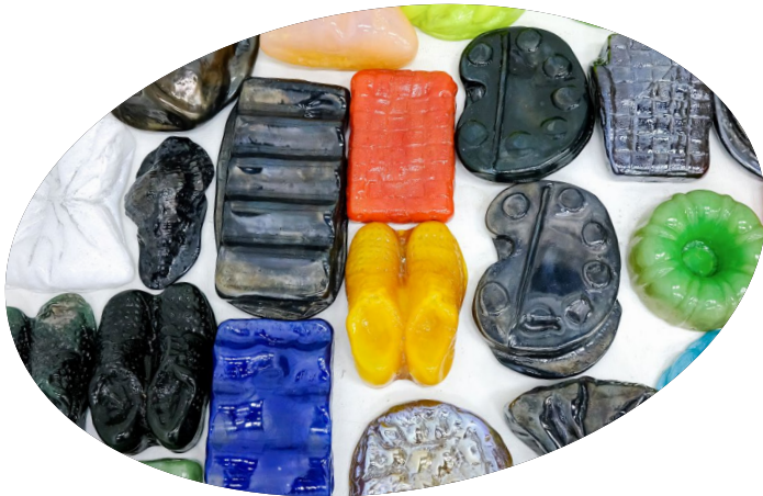
Nazif Lopulissa, objecten 'Sepia Days', Glasmuseum

Diverse stipendia en samenwerkingen beleefden in 2023 hun laatste editie. In 2024 zullen we de invulling van het flankerend beleid opnieuw tegen het licht houden.