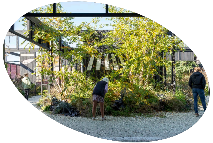
Joost Emmerik, Overtreders W, De Onkruidenier, 'Amsterdam Almere Paviljoen', Floriade

De commissie selecteerde uit de aanvragen vijf voorbeeldstellende plannen, waarbij ze het beschikbare budget evenredig verdeelde over toegepaste en autonome praktijken. De projecten zijn elk op hun eigen manier onderzoekend en uitdagend ten aanzien van de huidige status quo. Ook scoren ze hoog op samenwerking met partners binnen en buiten het eigen vakgebied en zichtbaarheid, bijvoorbeeld via een specifiek plan om de resultaten met een breed publiek te delen. Deze punten golden als belangrijke pijlers bij de toekenning.