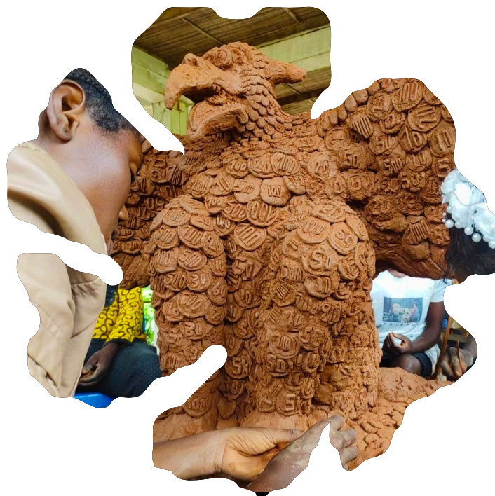
Mbuku Kimpala (lid CATPC), 'Envol du Couple de l'Égalité'

Stokroos ontving naar aanleiding van de oproep van 2023 maar liefst 124 uitgewerkte voorstellen, veelal van makers die op een overtuigende manier actief en ingebed zijn in het werkveld en zich in hun praktijk al intrinsiek verhouden tot de thematiek van de oproep. Uit het hoge aantal kunnen we opmaken dat er sprake is van een brede beweging die het van groot belang acht om een wereld voorbij het antropoceen te verbeelden en vorm te geven. Ook verbinden zij klimaatverandering aan andere maatschappelijke uitdagingen, zoals inclusie en economische gelijkheid. 40% van alle aanvragen betrof vormgeving, een relatief hoog percentage dat past bij ons streven naar een gelijkwaardige toedeling van middelen over de disciplines die we ondersteunen. Over zo'n 50 aanvragen bracht de commissie in de eerste beoordelingsronde een positief oordeel uit, wat de hoge kwaliteit van de voorstellen en de moeilijke opgave voor de commissie illustreerde.